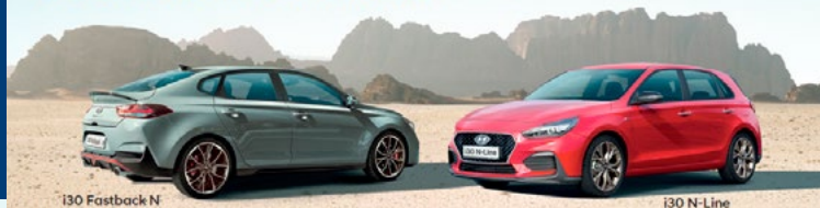
i30 Fastback N